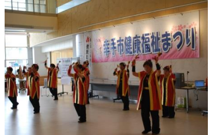
ステージ会場での公演の様子