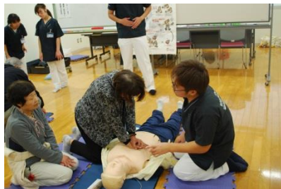
日本保健医療大学による やってみよう！心肺蘇生