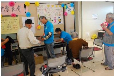
スーパー健康長寿サポーター による健康チェック