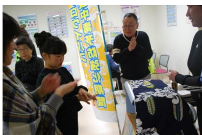
幸手食品衛生協会による 食中毒予防