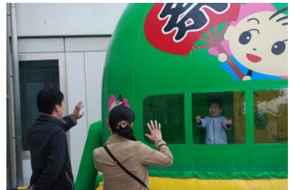
さっちゃんふわふわバルーン