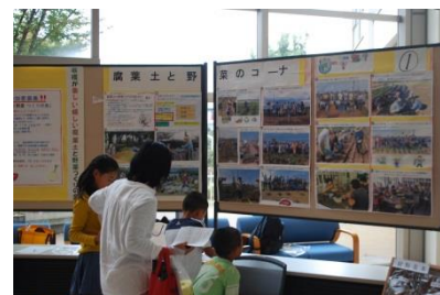
ボランティアグループ等の活動紹介・体験等