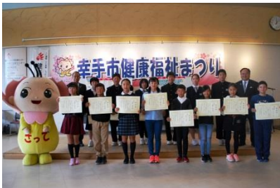
小中学生ボランティア 活動作品の表彰式