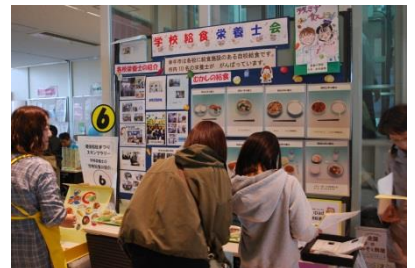
市内学校栄養士による 「学校給食の紹介」