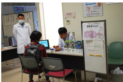
幸手市歯科医師会による 歯科健康相談