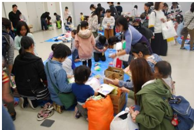
こども用品とりかえっこ