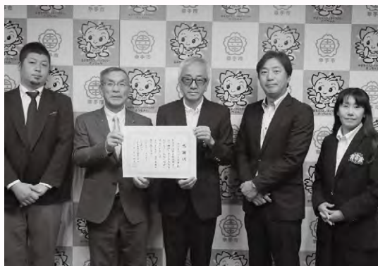
幸手市ゴルフ連盟 様