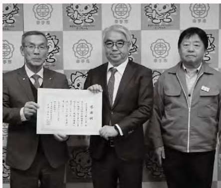
幸手都市ガス株式会社 様