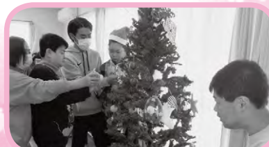
クリスマスツリーの飾付