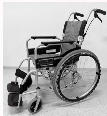
埼玉県トラック協会 久喜支部 様