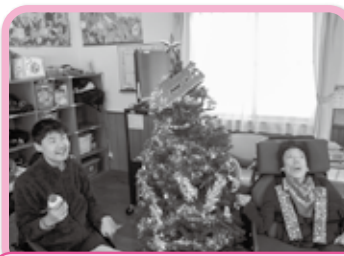
クリスマスに向けツリーの 飾りつけを行いました