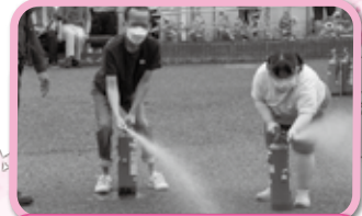
消火訓練を体験しました