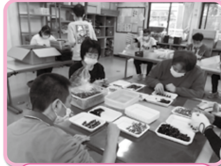
みんな熱心に作業へ取り組んでいます