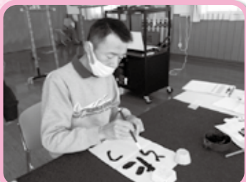
新年の抱負を書き初めにしました

日常生活の介護や創作的活動、季節の行事などを通じて生活の質の維持向上に取り組んでいます。