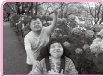
梅雨の晴れ間に あじさい見学に出掛けました