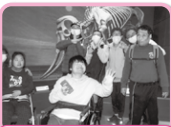
所外活動で茨城県自然博物館に 出掛けました