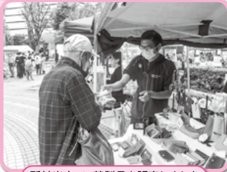
所外出店で、革製品を販売しました (セルプまつり)