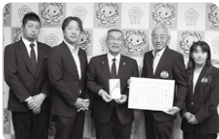
幸手市ゴルフ連盟 様