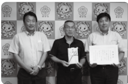
株式会社白石工務店 様