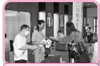
赤い羽根街頭募金に参加しました