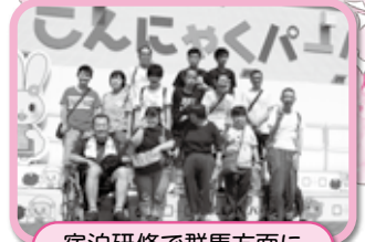
宿泊研修で群馬方面に行ってきました