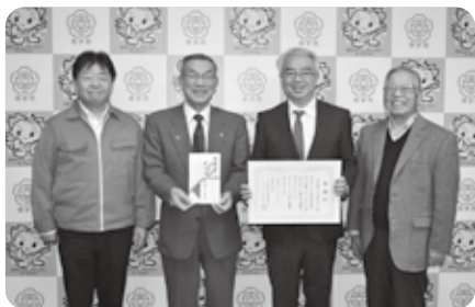
幸手都市ガス株式会社 様