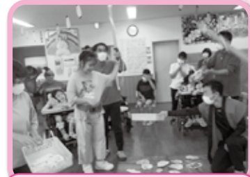
お楽しみ会で魚釣りゲームを 楽しみました