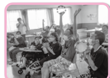
毎月音楽会を実施しています