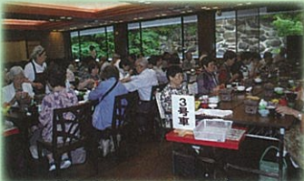
65歳以上のひとり暮らしの 方へ日帰りバス旅行