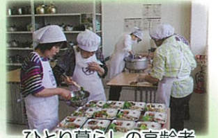
ひとり暮らしの高齢者 などへお弁当を配達