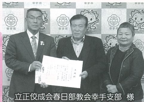
立正佼成会春日部教会幸手支部 様