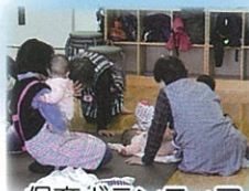
保育ボランティア