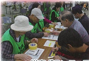
災害ボランティアセンターの運営訓練