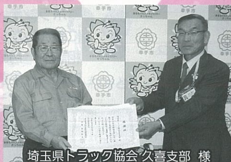
埼玉県トラック協会 久喜支部 様