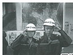
工場見学・施設見学に行きました