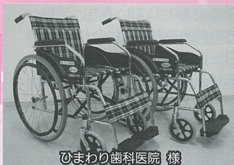
ひまわり歯科医院 様