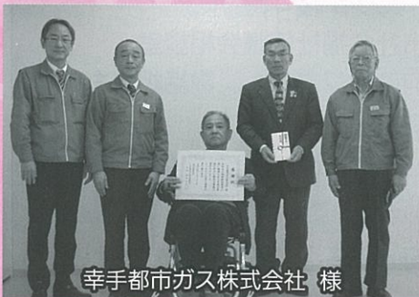
幸手都市ガス株式会社 様