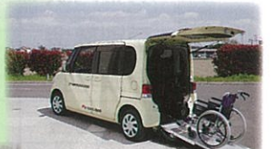
車椅子・介護用ベッド・ 車椅子同乗車両の貸出