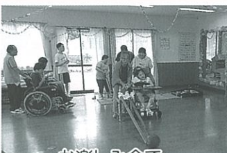
お楽しみ会で レクリエーション大会