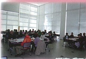
災害ボランティア研修