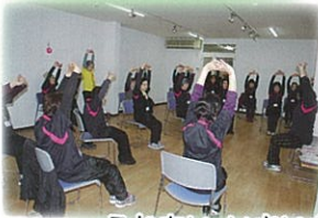
ふれあい・いきいきサロンの活動支援