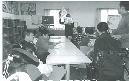
スタッフの紙芝居