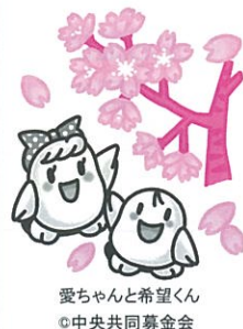
愛ちゃんと希望くん