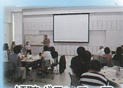
傾聴ボランティア 養成講座