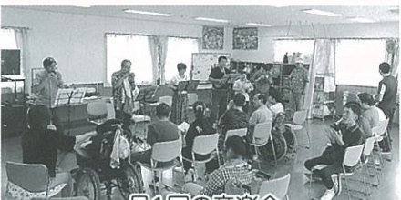
月1回の音楽会 ボランティアさんとの交流もします