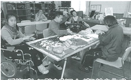
季節ごとに壁を彩るちぎり絵を作成