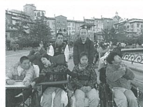
所外活動 ディズニーシーに行きました