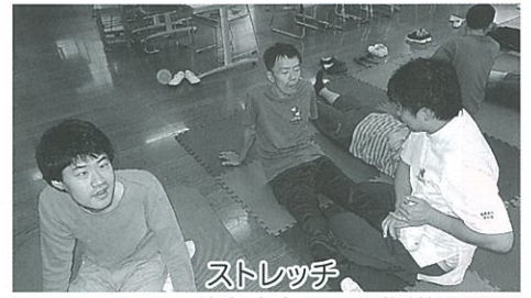
ストレッチ 週1回理学療法士さんの指導を受けています