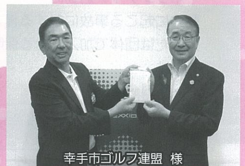
幸手市ゴルフ連盟 様