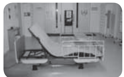
介護ベッド(電動式)

このような事業を展開できるのは、皆様に会員という形でご協力いただいた結果です。今後も、様々な事業を継続・展開していくにあたり、より多くの皆様のご協力をよろしくお願いいたします。