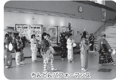
ちんどんパフォーマンス