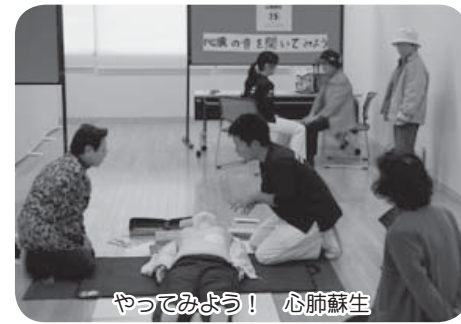
やってみよう！心臓蘇生