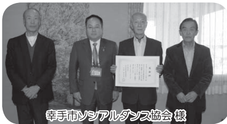
幸手市ソーシャルダンス協会 様