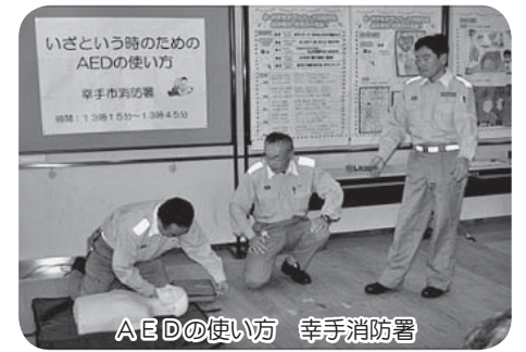
AEDの使い方 幸手消防署