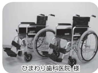
ひまわり歯科医院 様