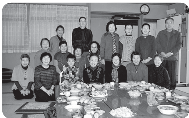
サロンの皆さん、とてもすてきな笑顔です。

社協では、「ふれあい・いきいきサロン」への助成を行っており、その中の1つを紹介します。