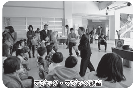
マジック・マジック教室