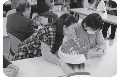
いつもお世話になっている民生委員さんと、ピンゴゲームをやったり、マジックを披露していただきました。