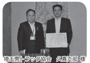
埼玉県トラック協会 久喜支部 様