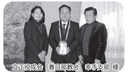
立正佼成会 春日部教会 幸手支部 様