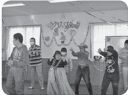
日頃、お世話になっているボランティアさんや保護者を招き、ケーナ鑑賞会、フラダンス発表会、ピンゴ大会等を行いました。歌ったり踊ったりと、楽しいひとときを過ごしました。