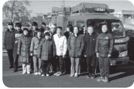
消防職員さんの指導のもと、素早く避難することができました。