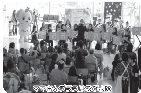
ママさんプラスはるびよ隊