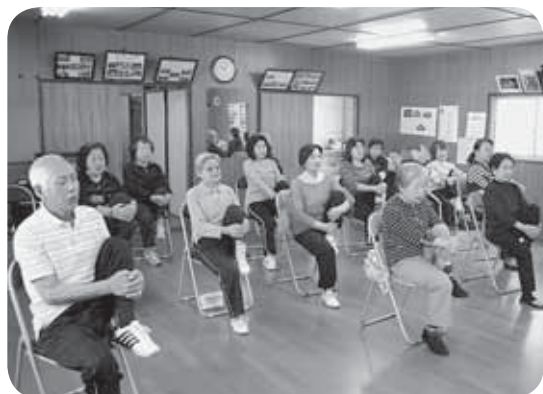
写真は、体操のひとこまでです。