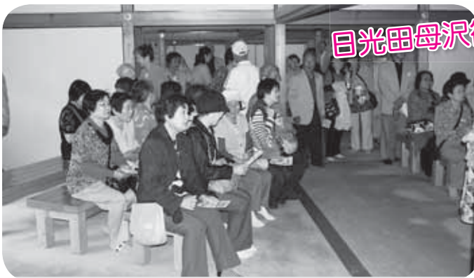
日光田母沢御用邸記念公園

今年は、栃木県鬼怒川温泉方面へ日帰りバス旅行を実施しました。ホテルでの食事や温泉の入浴、日光田母沢御用邸記念公園の見学や磐梯日光店での買い物など、皆それぞれ楽しく過ごしていました。