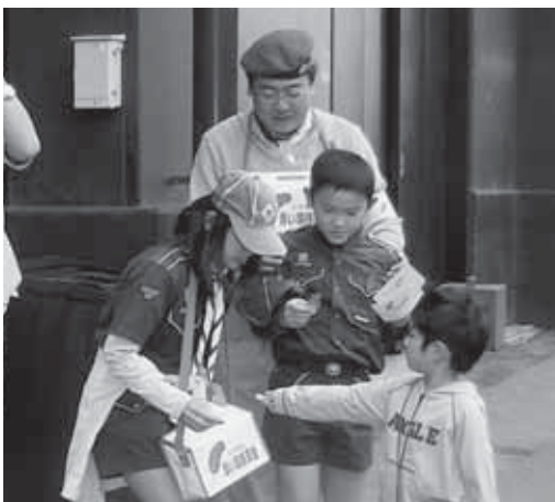
「赤い羽根共同募金」街頭募金活動の様子