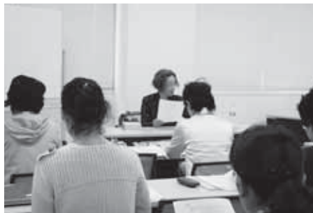
音訳朗読の基本を学ぶ (実習)