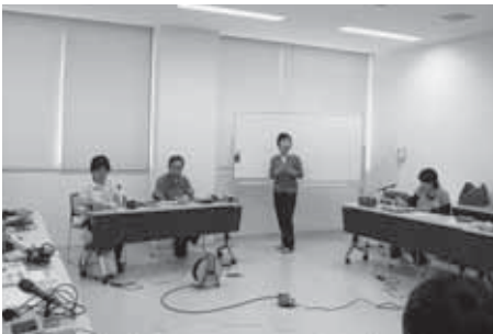
デジタル録音実習