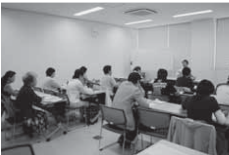
音訳朗読ボランティアについての講演