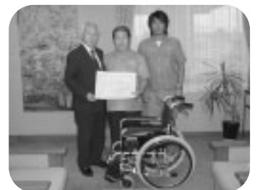
埼玉県トラック協会久喜支部 様