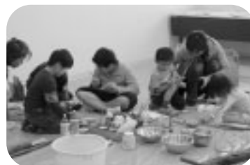
石と木を使って作ろう