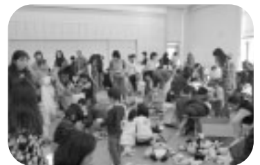
子ども用品とりかえっこ