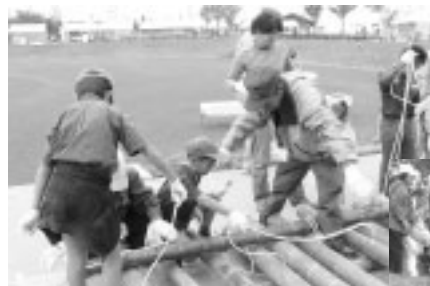
指導員のもとで浮島を組み立てました。