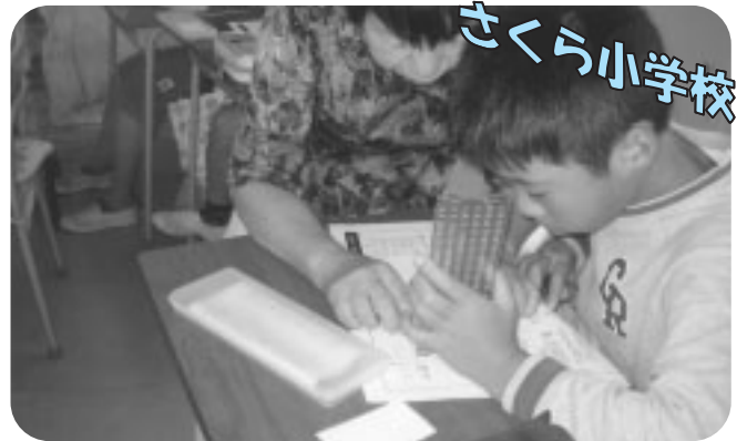
総合的学習「点字体験」