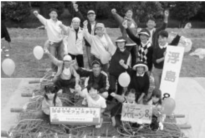
完成した浮島の上で記念撮影。

埼玉県では、「川の国埼玉」の実現に向けて「川の再生」に取り組み、権現堂調節池（行幸湖）の水辺を豊かにする浮島づくり（権現堂調節池 浮きウキフェスタ22 - 「川の再生」の体験イベント）にも参加・協力をしています。