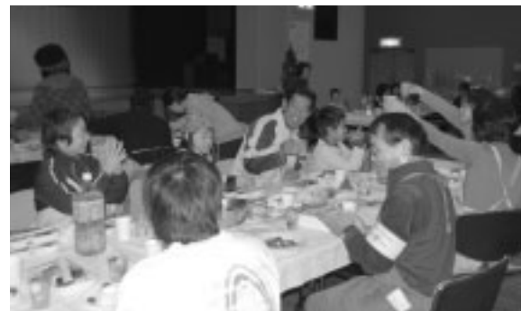
食事と懇談で楽しいひとときを過ごしました。