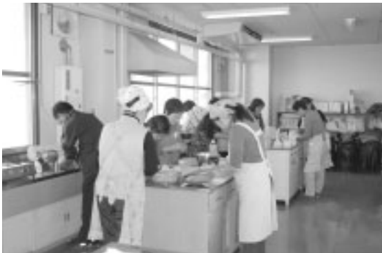
皆さん、真剣に調理に取り組んでいました。

「精神保健福祉ボランティア さくら'96」は、精神障がいをお持ちの方（メンバー）とボランティアとの交流を目的に、「さくらサロン」「食事会」を開催しています。みんなで調理し、食事や懇談等で楽しいひとときを過ごしました。