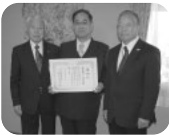
幸手都市ガス(株) 様