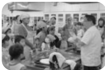
親子ピザ作り教室