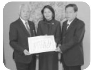
立正佼成会春日部教会幸手支部 様