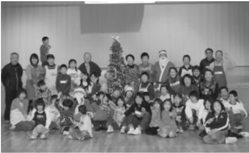
ボランティアさんと一緒に記念撮影です。

みんなで調理したケーキやサラダなどをおいしくいただき、食後はオカリナ演奏、ふうせんバレーゲームなどで楽しい1日を過ごしました。