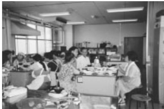
会食・懇談風景です。

「精神保健福祉ボランティア さくら'96」の活動に興味があり一緒に活動して下さる方を募集しています。幸手市社会福祉協議会までご相談ください。