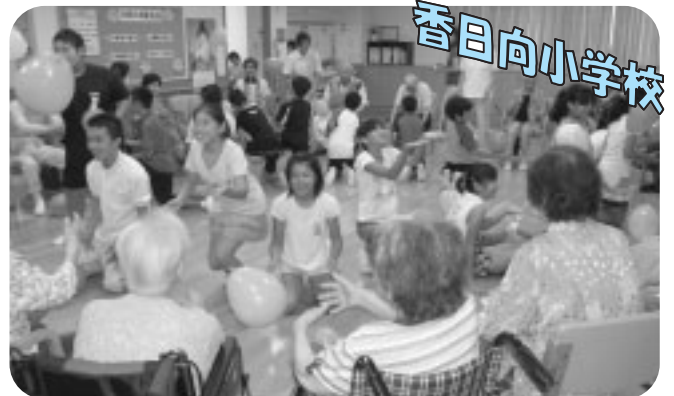
デイサービス施設「そよ風」訪問