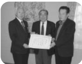
幸手明るい社会づくりの会 様