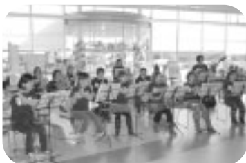
ママさんプラス はるびよ隊