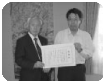
幸手市栄商店会協同組合 様