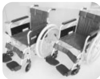
ひまわり歯科医院 様