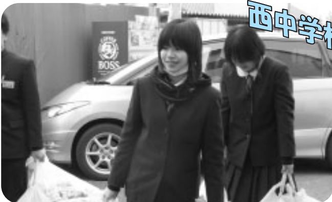
エコキャップの収集