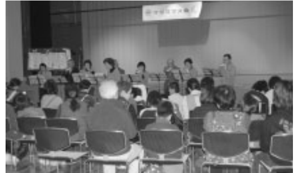
ボランティアさんのオカリナ演奏です。