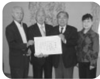
幸手市ソーシャルダンス協会 様