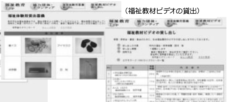
(福祉教材ビデオの貸出)