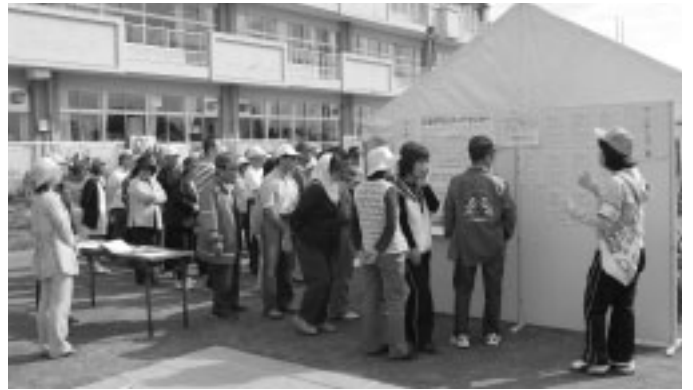
被災者からの支援ニーズとボランティアの活動希望を結び付ける役割を担当します。