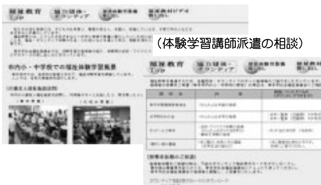
(体験学習講師派遣の相談)