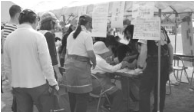
災害復興協力ボランティアの受付業務を担当します。