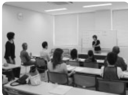
手話講座の1日目は、挨拶表現から始まりました。