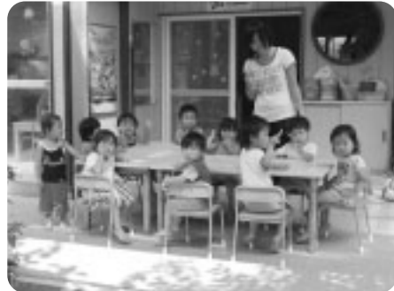
これから水着に着替え、プール遊びです。