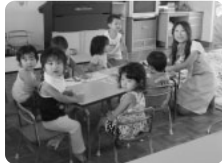
まもなく楽しいお食事タイムです。