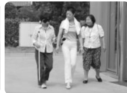
障がい者疑似体験や簡単なガイド法を体験しました。