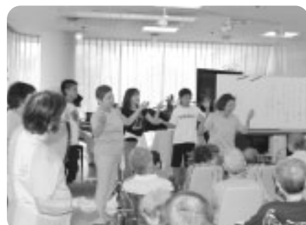
みなさんと唄ったり、楽器演奏をしました。