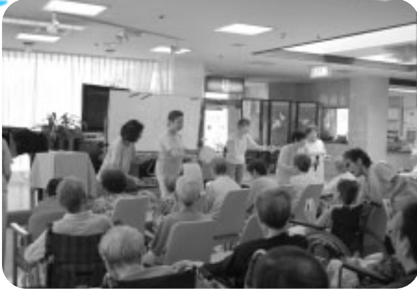
しらさぎ苑で月1回の定例訪問活動