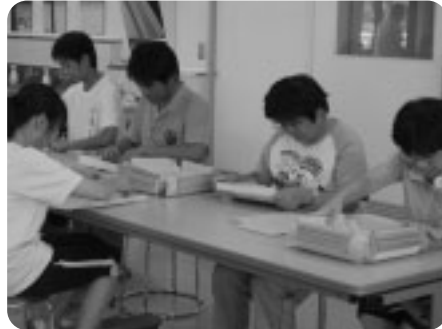
デイケア施設では、職員や利用者の方に交り、軽作業のお手伝い。