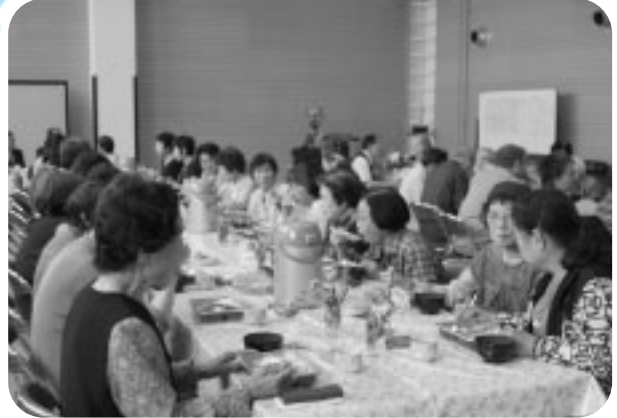
中央公民館で年3回の会食会