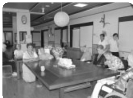
利用者の方々と記念撮影です。