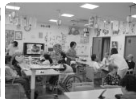
今日は、夏まつりのお手伝いです。