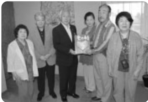
幸手カラオケ連合会 様