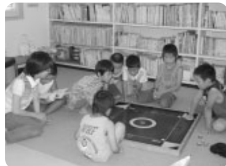
夏休み期間のため、館内は児童でいっぱいでした。