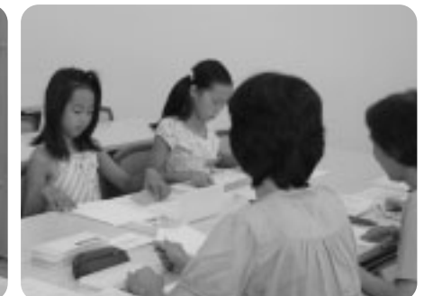
点字って難しいなあ。