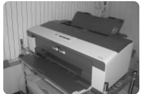
幸手市子ども会育成連絡協議会 様