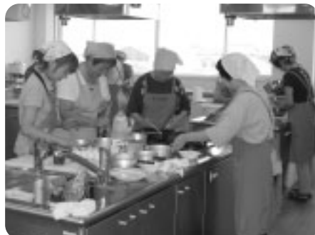
お弁当作りのお手伝いです。