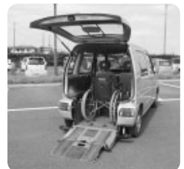
車椅子同乗車輛貸出事業