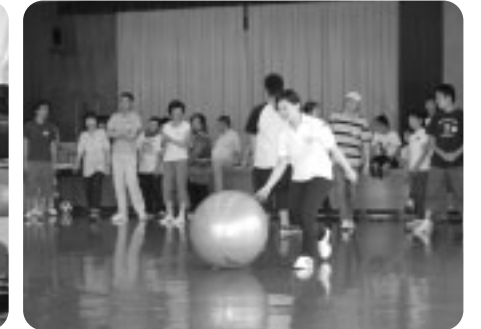
ミニ運動会やゲームで楽しく過ごしました。