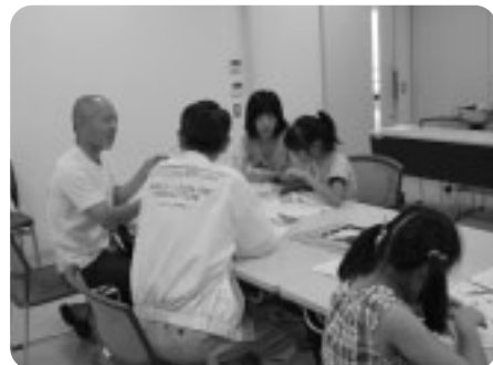
おもちゃドクターの指導で電子オルゴールの製作を体験。