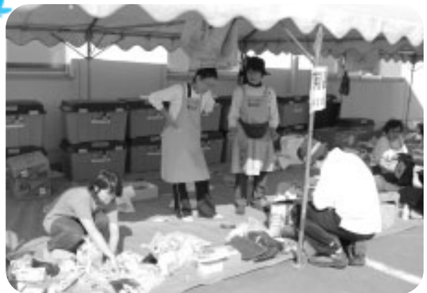
あやめ寮のバザーに協力