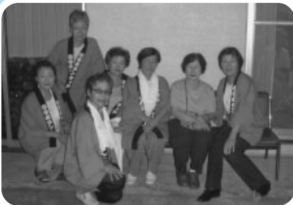
しらさぎ苑の盆踊り大会へ参加