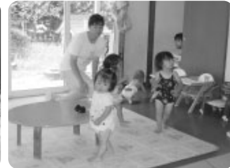
お姉さん、あそびましょう。