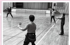
(上/練習風景、下/イベントでの披露の様子)