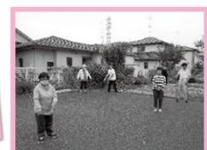
★毎日を動かしています★