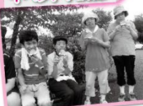
★夏祭りを楽しみました♪★