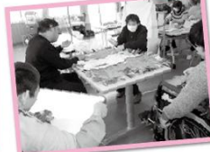
★季節ごとの壁面制作★