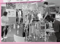
★手作りの七夕飾り★