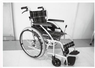
埼玉県トラック協会 久喜支部 様