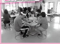
★集中して作業に取り組んでいます★