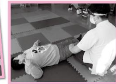
★理学療法士の指導★