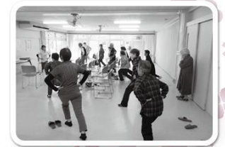
ふれあい・いきいきサロンの 活動支援