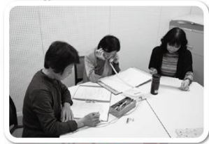
ひとり暮らしの高齢者と 電話を通して交流