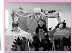
★ハロウィンの仮装★