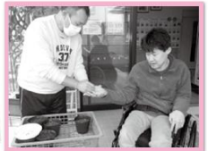
★ヒマワリの種を蒔きました♪★