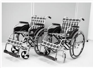
ひまわり歯科医院 様