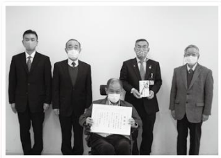
幸手都市ガス株式会社 様