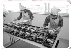
ひとり暮らしの高齢者などへ 手作りお弁当のお届け