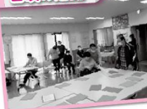
★様々なレクリエーション★