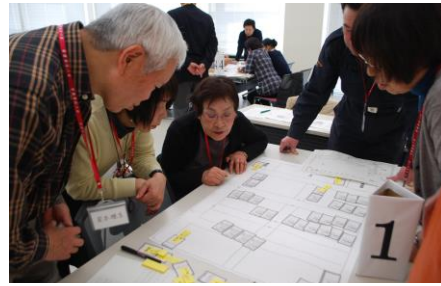
災害ボランティアの研修