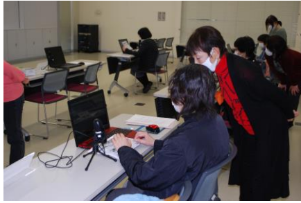
音訳朗読ボランティアの育成