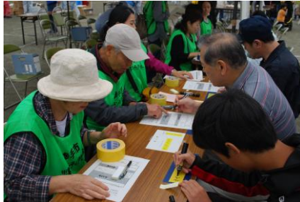
災害ボランティアセンター 立ち上げ訓練