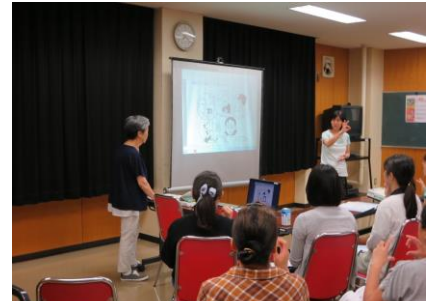
手話講習会の開催