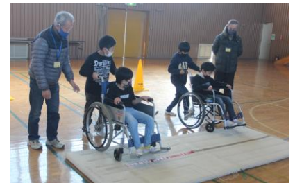
市内小中学校での福祉教育