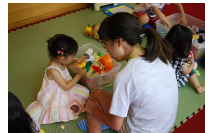
初めてのボランティア体験 (子育てサロンでの手伝い)