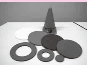
スカイクロスミニ