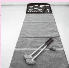
ポケットボールセット