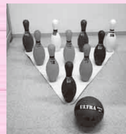
カラーボウリングゲーム