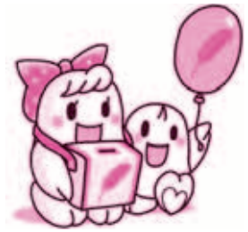
愛ちゃんと希望くん

明るく住みよい地域社会をつくるため、皆さまからの温かい思いやりとご支援をお待ちしております。