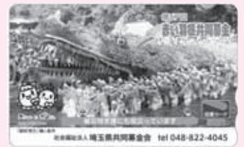
鶴ヶ島市「脚折雨乞」