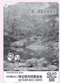
嵐山町「紅葉の嵐山溪谷」