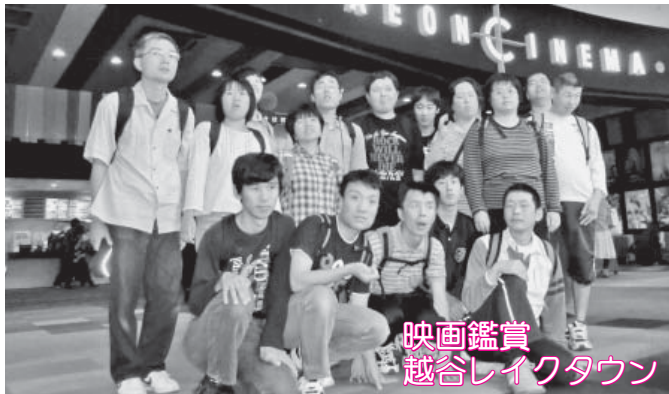
映画鑑賞 越谷レイクタウン