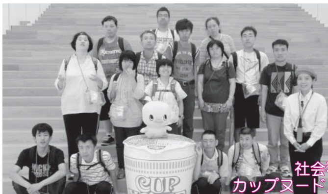
社会科見学 カップヌードルミュージアム