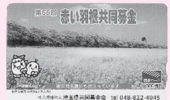
幸手市権現堂堤 桜と菜の花