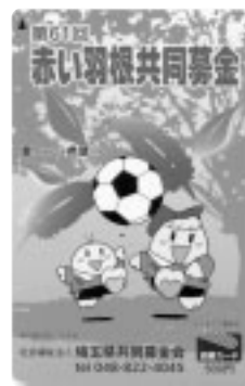
①図書カード〔1,000円〕 〔内募金額500円〕