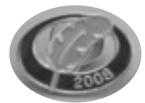
③募金バッジ 募金額 500円～