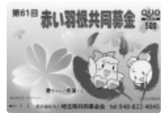
②クオカード〔1,000円〕 〔内募金額500円〕